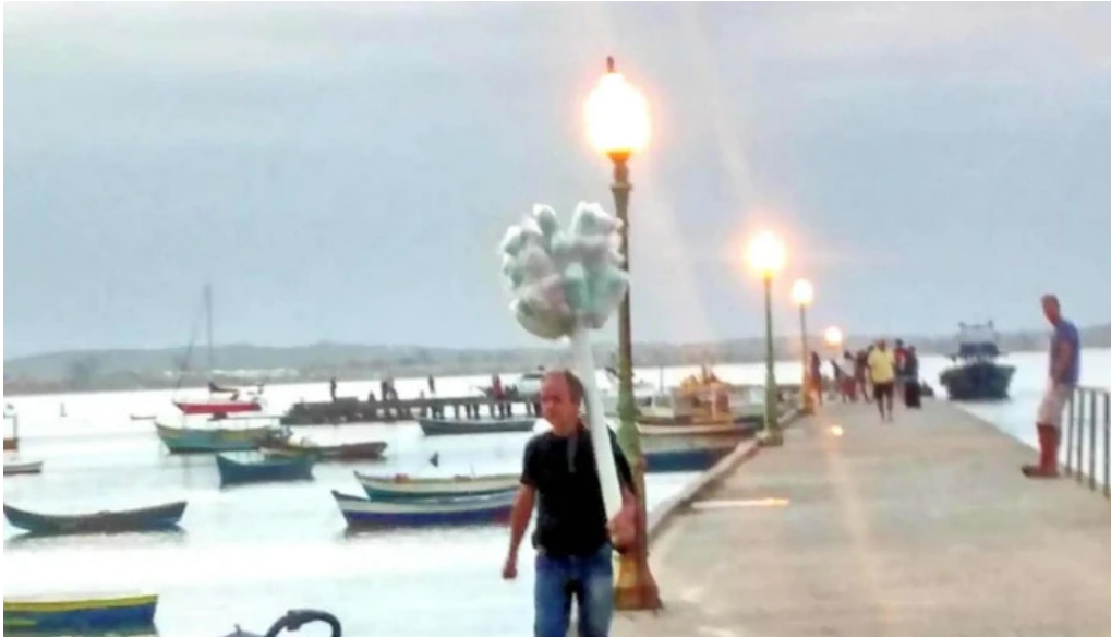
Geriba surf porto da barra buzios pontuacao