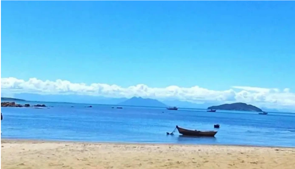
Geriba surf porto da barra buzios mais recentes