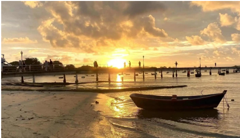
Geriba surf porto da barra buzios endereco