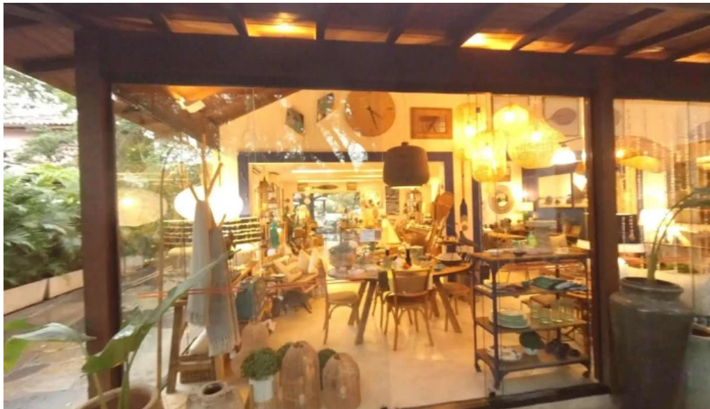
Geriba surf porto da barra buzios street view e 360deg