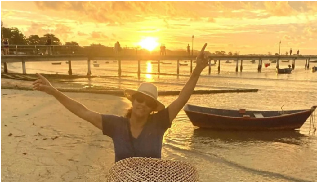
Geriba surf porto da barra buzios como chegar