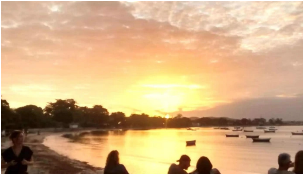
Geriba surf porto da barra buzios loja de roupa