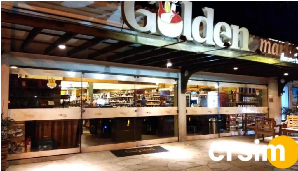
Geriba surf porto da barra buzios interior