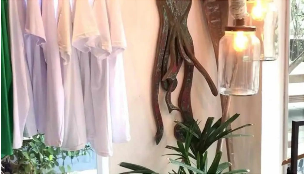
Geriba surf porto da barra buzios do proprietario