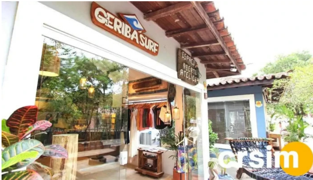
Geriba surf porto da barra buzios tudo