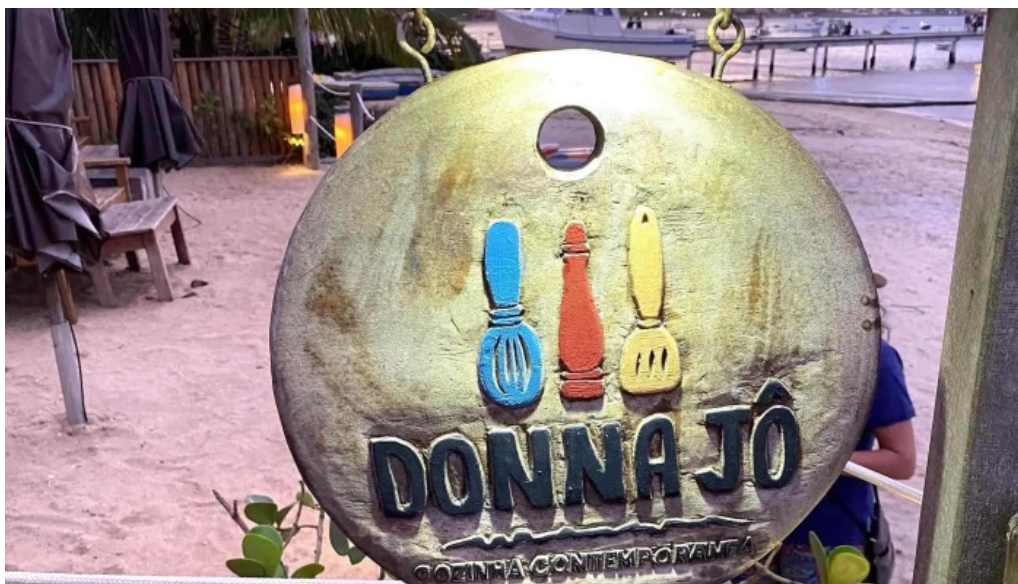
Geriba surf porto da barra buzios catalogo