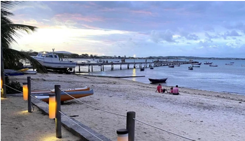
Geriba surf porto da barra buzios onde