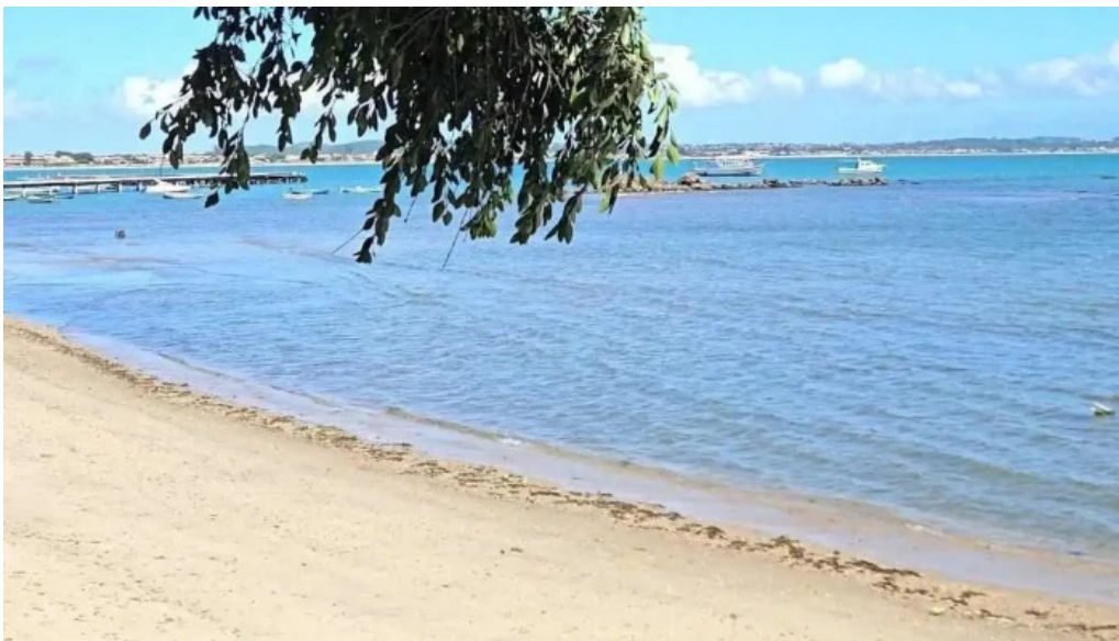
Geriba surf porto da barra buzios videos