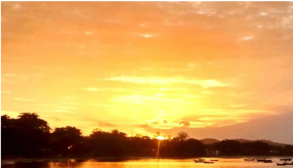
Geriba surf porto da barra buzios opinioes