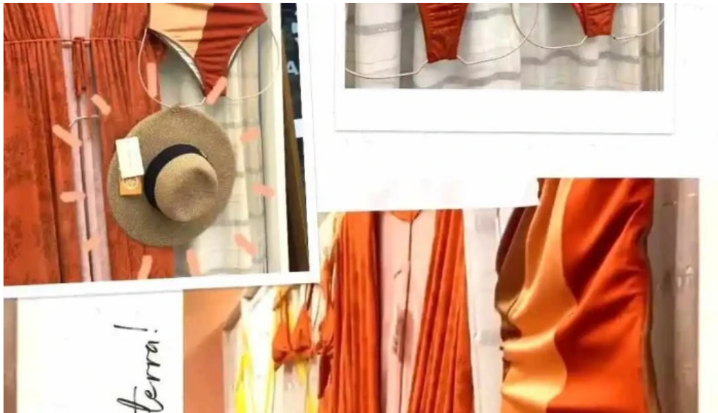
Enseada brands interior