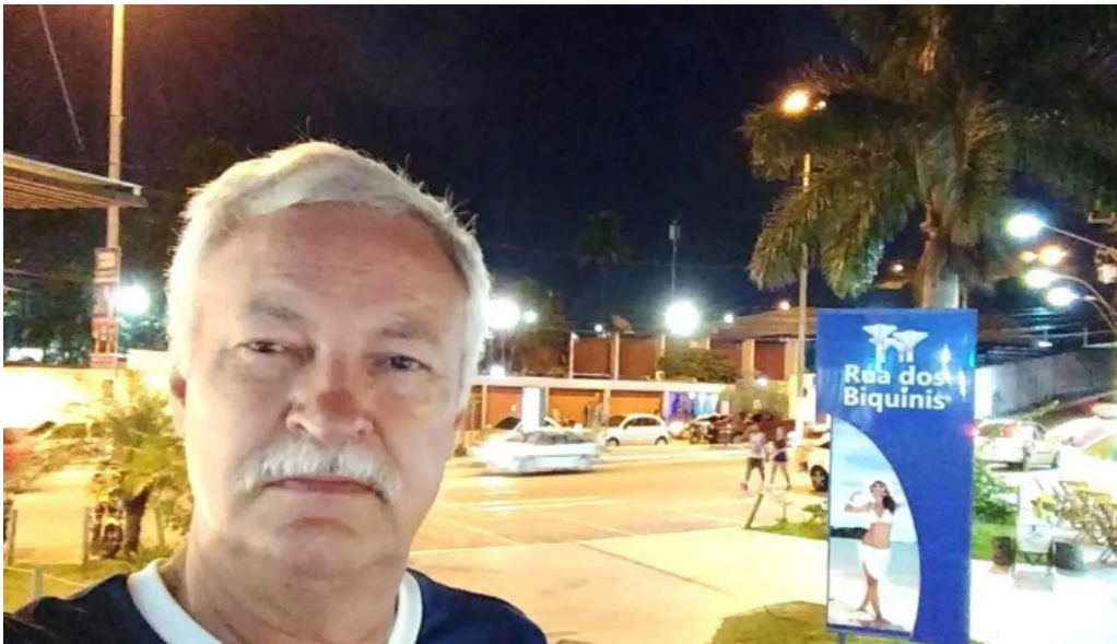
Enseada brands precos