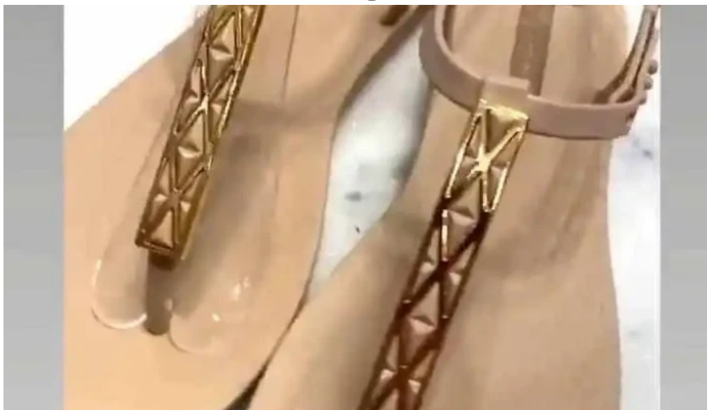
Enseada brands videos