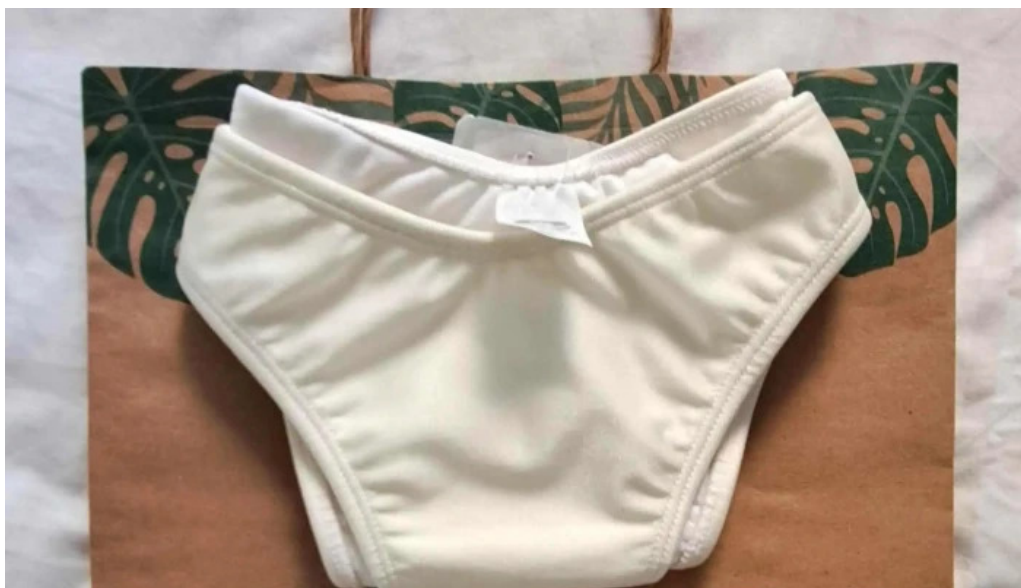
Enseada brands loja de roupas de praia