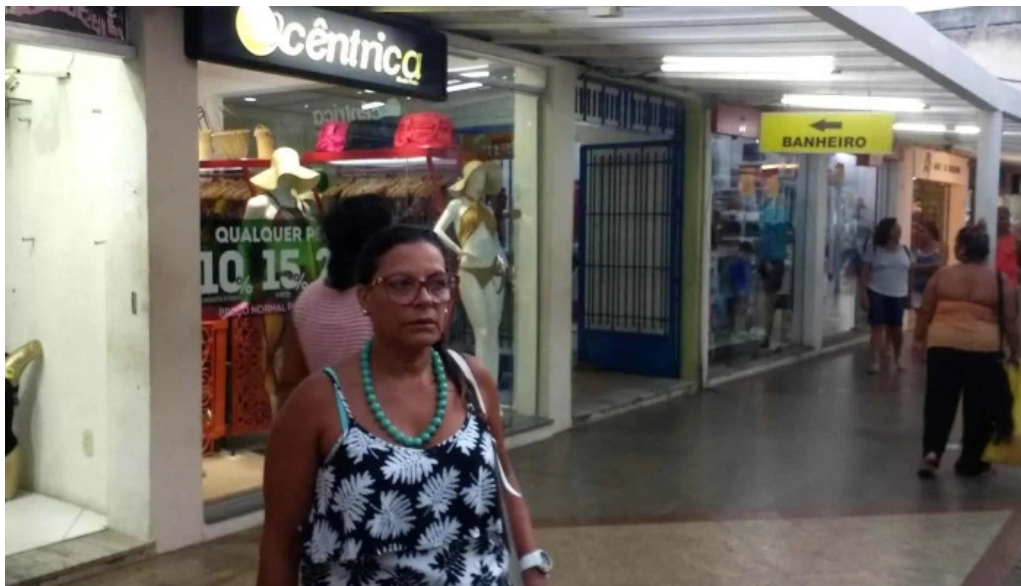
Enseada brands cabo frio