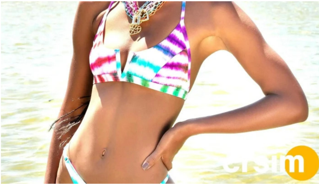
Enseada brands tudo