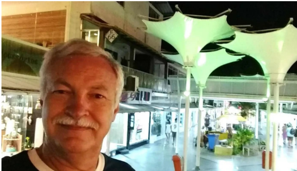
Enseada brands endereco