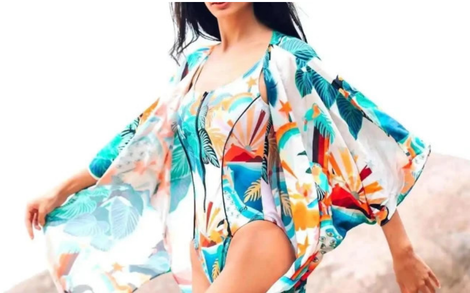
Enseada brands do proprietario