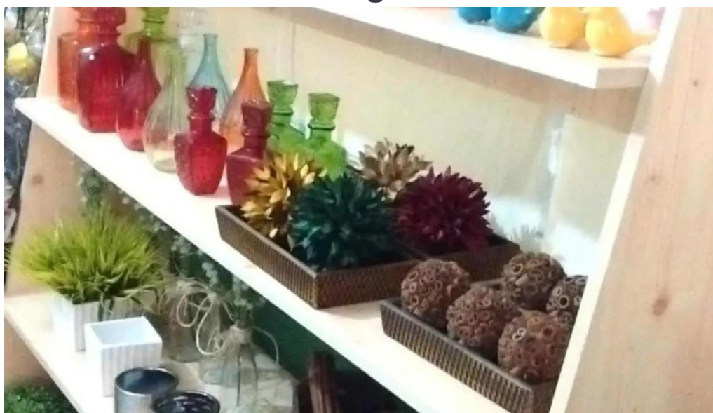
Di angra tudo