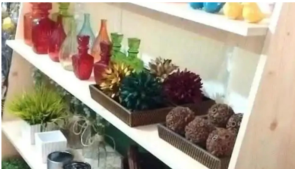
Di angra angra dos reis