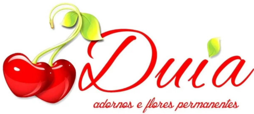
Di angra do proprietario