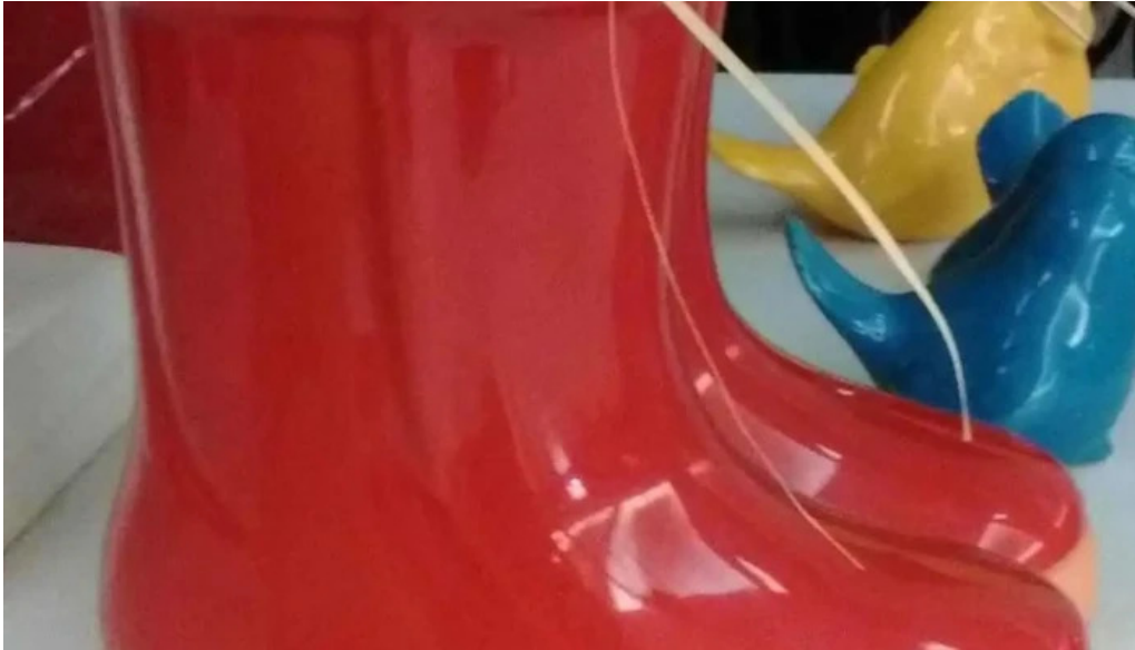
Di angra interior