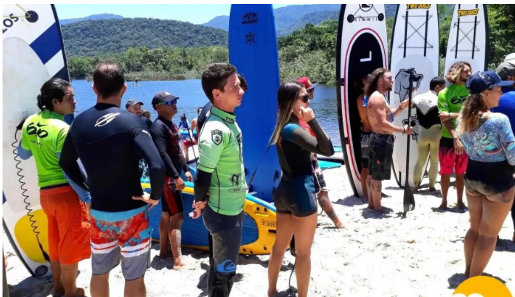
Mr surf classic calcao