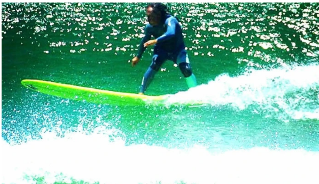
Mr surf classic prancha de surfe