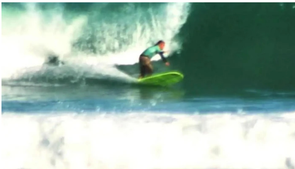
Mr surf classic arraial do cabo