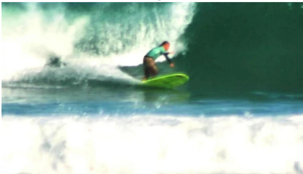
Mr surf classic tudo