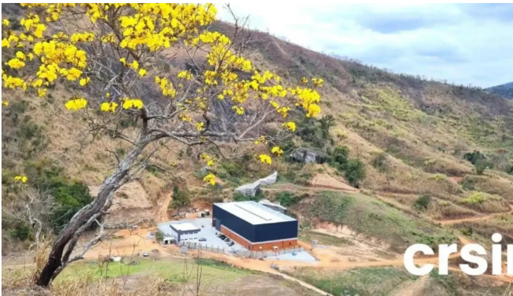
Newstec servico tecnico em montagem manutencao de caldeiras e construcoes tudo