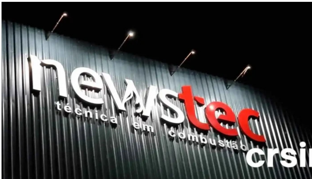
Newstec serviço tecnico em montagem manutencao de caldeiras e construcoes do proprietario