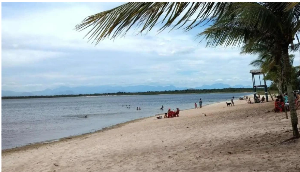
Praia de carapebus carapebus