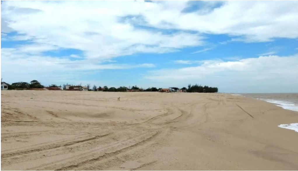
Praia de carapebus precos