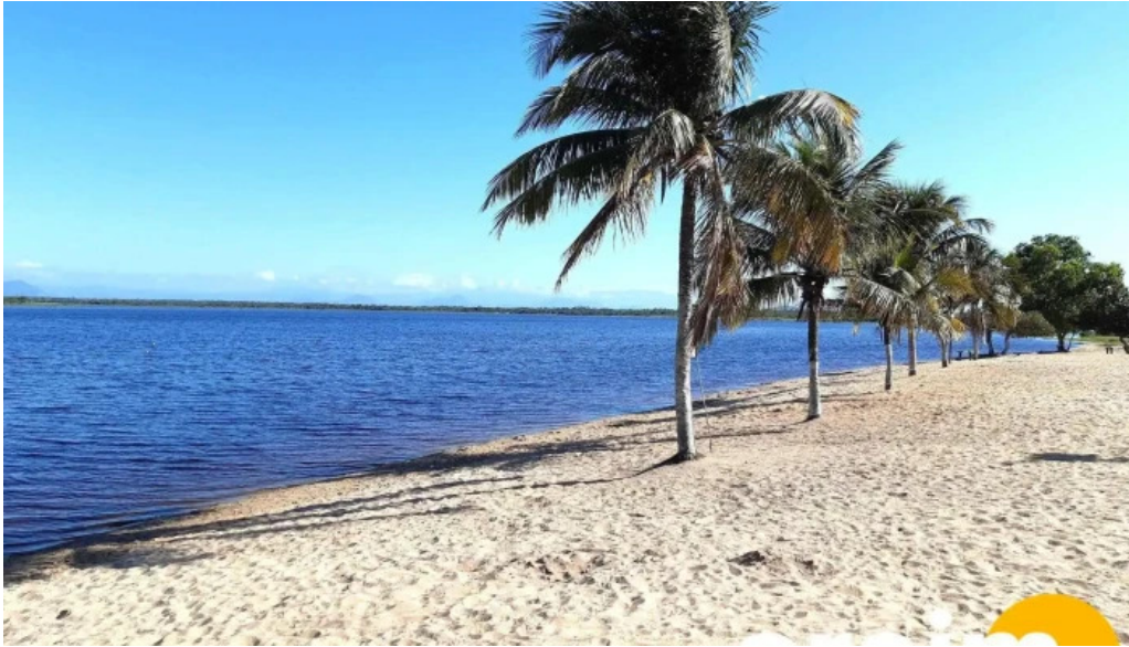
Praia de carapebus tudo