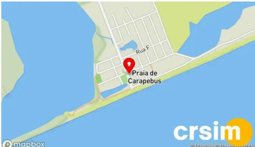
Praia de carapebus mapa