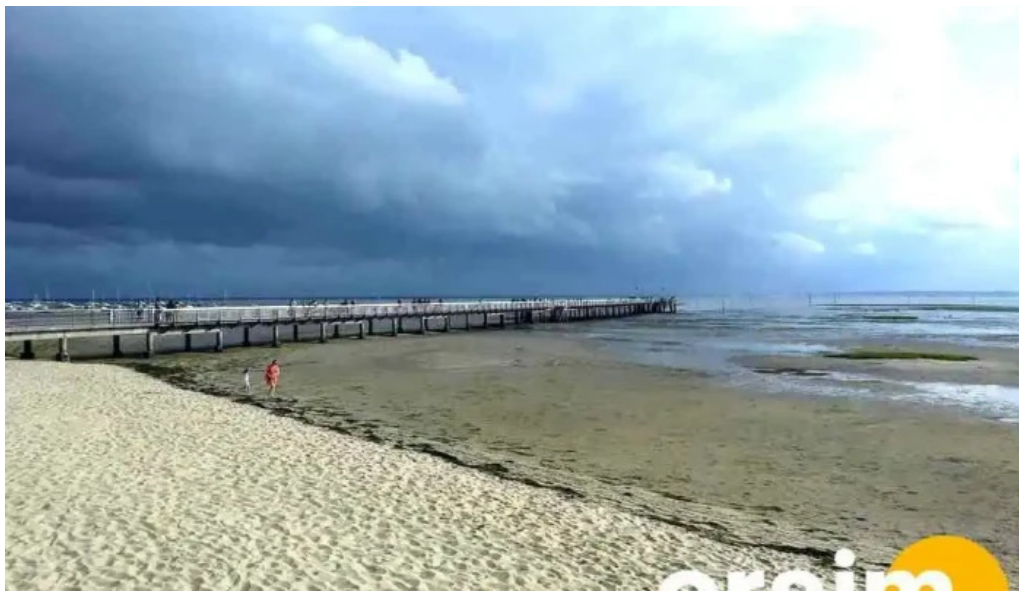
Praia de carapebus mais recentes