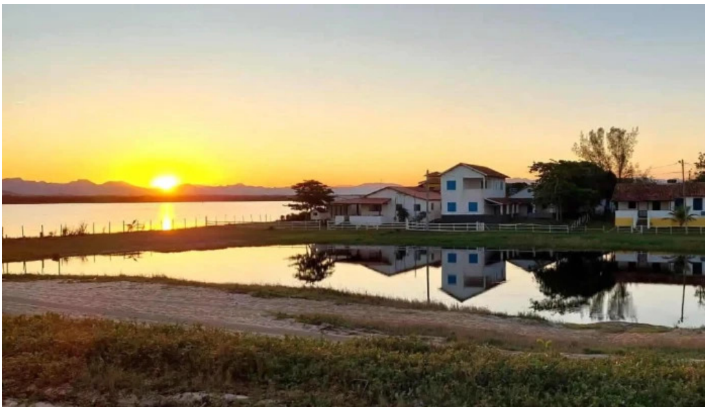
Praia de carapebus onde