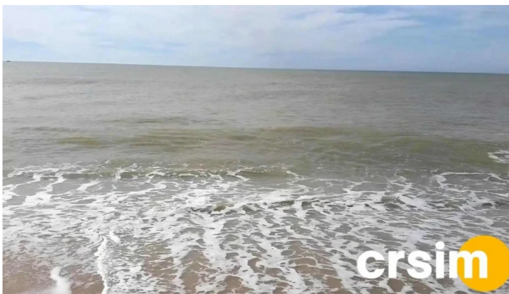
Praia de carapebus videos