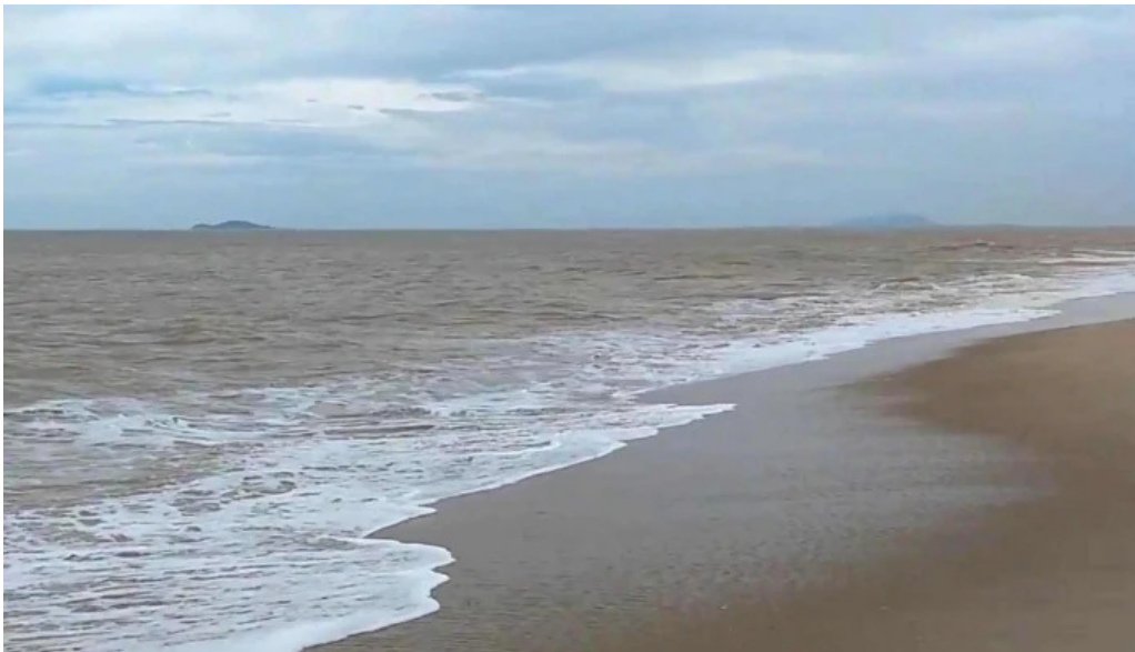
Praia de carapebus praia