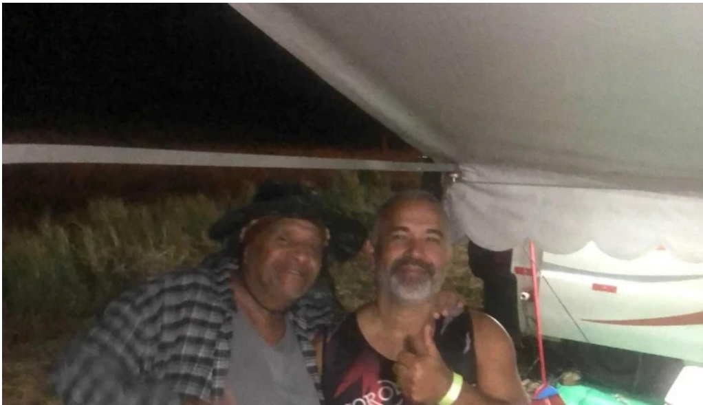
Praia de carapebus telefone