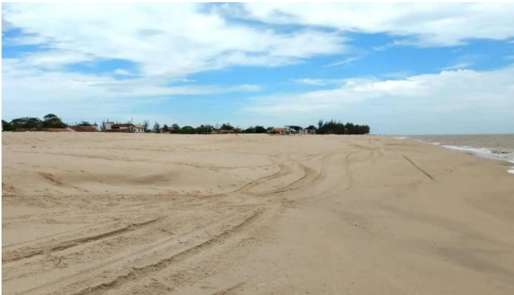
Praia de carapebus catalogo