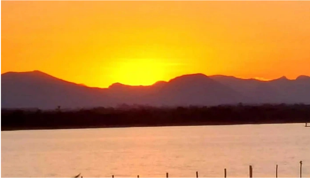
Praia de carapebus instagram